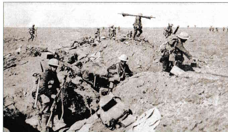
Aspecte din timpul bătăliei de pe Somme

Pe frontul austro-italian, armata italiană a desfășurat între 6–17 august 1916 a șasea bătălie de la Isonzo, cucerind Monte Sabatino și Gorizia. Pe fondul acestor succese, odată cu aderarea României la Antantă, Italia a declarat război Germaniei la 14/27 august 1916.