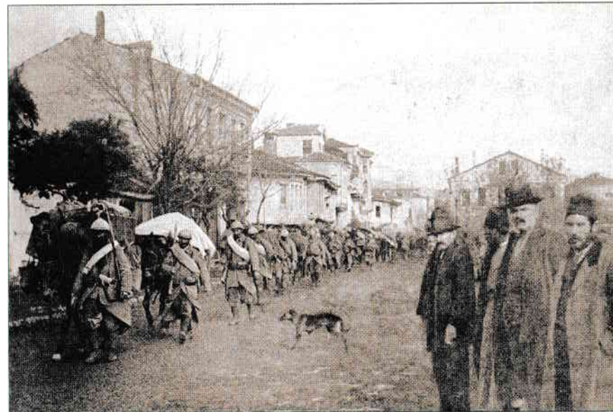
19 noiembrie 1916. Trupe franceze intră în Monastir.

generalul Erich von Falkenhayn a fost înlocuit din funcția de șef al statului major general german. Împăratul l-a numit pe mareșalul Paul von Hindenburg, secondat de Erich von Ludendorff. Cei doi au condus armata germană până la sfârșitul războiului, subordonând necesităților acestuia întreaga politică a Germaniei. Două cauze au dus la demiterea lui Falkenhayn – eșecul de la Verdun și aprecierea greșită a momentului intrării României în război. El a fost numit comandant al Armatei IX care a dat mult de furcă armatei române.