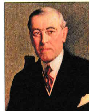
Woodrow Wilson (1856–1924), președinte al SUA, una dintre personalitățile care au dominat Conferința de pace de la Paris.

Intrând într-un conflict mondial, SUA înțelegeau să-i pună capăt și să modeleze configurația lumii postbelice potrivit valorilor și principiilor proprii. Cele 14 puncte au fost împărțite de Wilson în două secțiuni – obligatorii și deziderabile. În prima categorie au intrat, între altele, diplomația deschisă, accesul liber la spațiile maritime și oceanice, rezolvarea problemelor coloniale, reducerea armamentelor, libertatea comerțului și desființarea barierelor comerciale, evacuarea teritoriilor rusești și înființarea unei organizații internaționale – Liga (Societatea) Națiunilor – investite cu misiunea de a armoniza interesele contradictorii ale statelor și de a asigura pacea